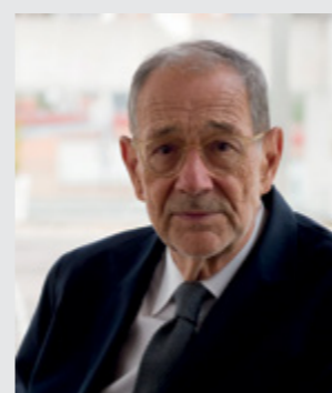
Dr Javier Solana Président d'honneur