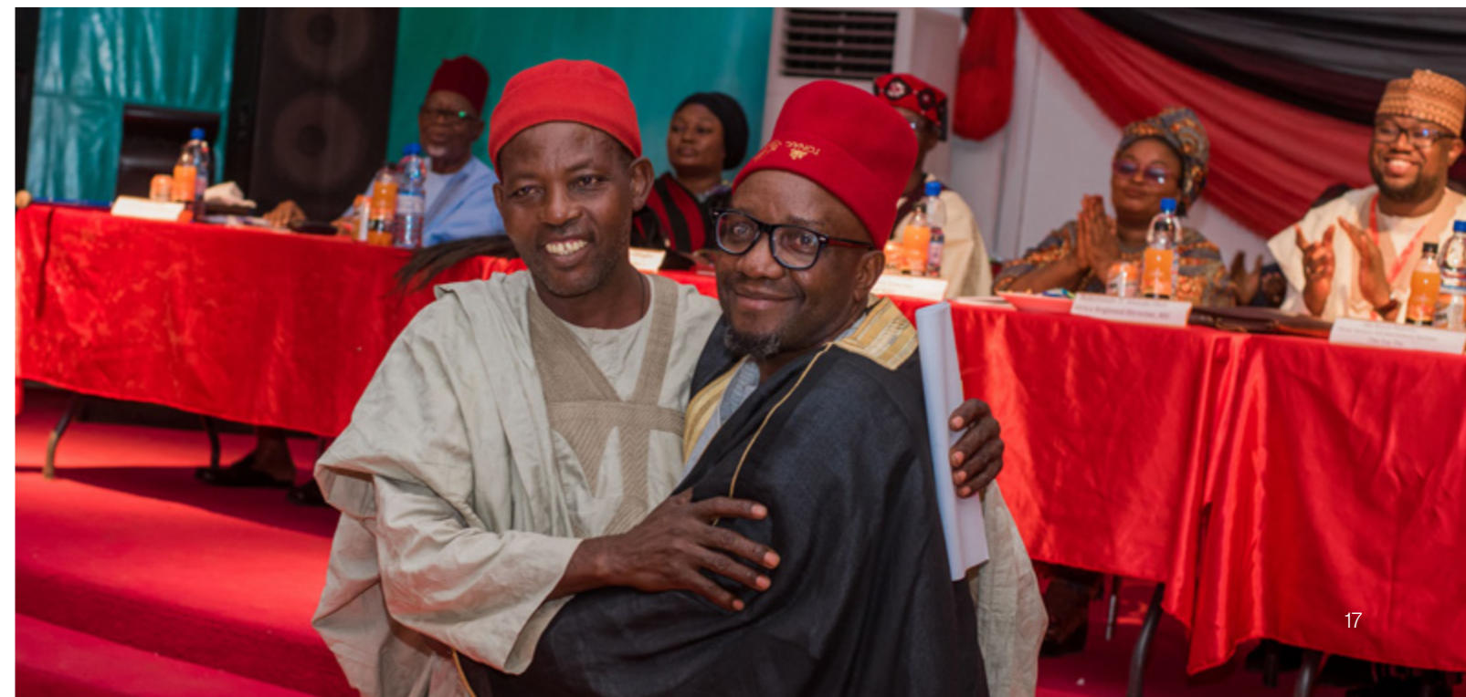
Les chefs de clans Egba et Ologba se donnent une accolade après avoir signé l'Accord sur les ressources naturelles d'Agatu (Nigéria).

Six accords humanitaires facilités par notre organisation entre différentes communautés – avec la participation indirecte de groupes armés – ont instauré une trêve et permis la libre circulation des personnes, la reprise des activités économiques et, dans certaines zones, le retour de personnes déplacées.