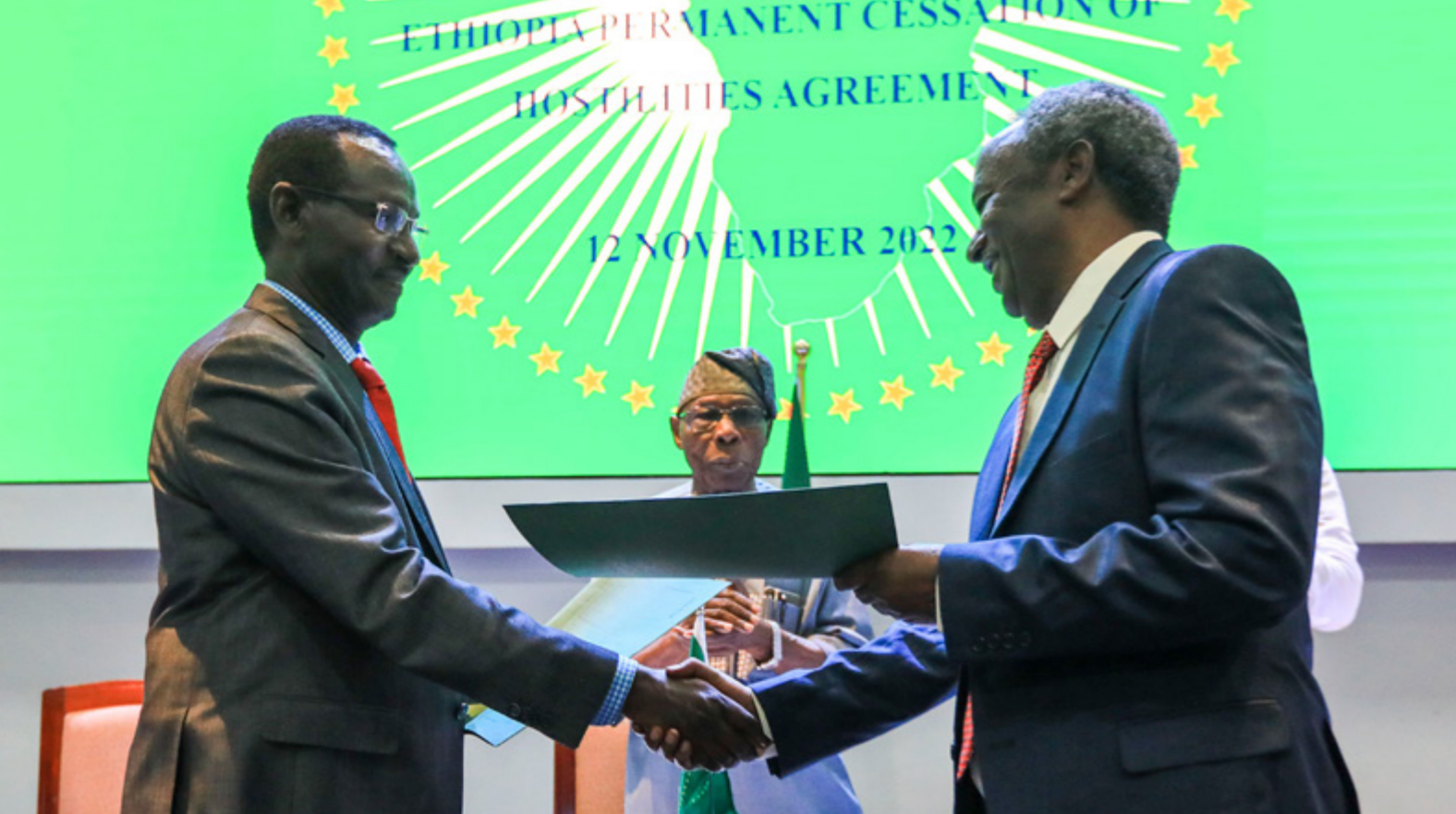
Sous le regard de l'ancien président nigérian Olusegun Obasanjo, le maréchal Birhanu Jula, de l'armée éthiopienne, et le général Tadesse Werede, du Front de libération du peuple du Tigré, échangeant des documents sur la mise en œuvre de l'accord de cessation des hostilités en Éthiopie.

Pour soutenir les tentatives d'apaisement du conflit et aider le pays à relancer son processus politique, HD a continué à échanger discrètement avec une multiplicité d'acteurs.