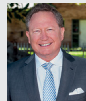
Andrew Forrest Mécène international

Pour en savoir plus sur le Conseil de fondation de HD et ses membres, scannez le code QR :