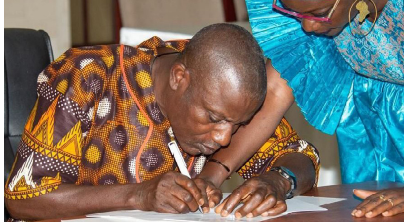
Le général César Atoute Badiate, du Mouvement des forces démocratiques de Casamance, signe un accord avec le gouvernement sénégalais portant sur une feuille de route pour le désarmement après des négociations soutenues par HD et le gouvernement de Guinée-Bissau.

HD a soutenu la création de nouveaux réseaux de médiation formés de chefs religieux. Les initiatives de médiation locale ainsi mises en œuvre ont donné naissance à six accords qui ont réglé des conflits dans les régions du nord et du centre du pays.