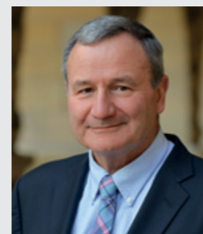
M. l'ambassadeur Karl Eikenberry Membre du Conseil de fondation