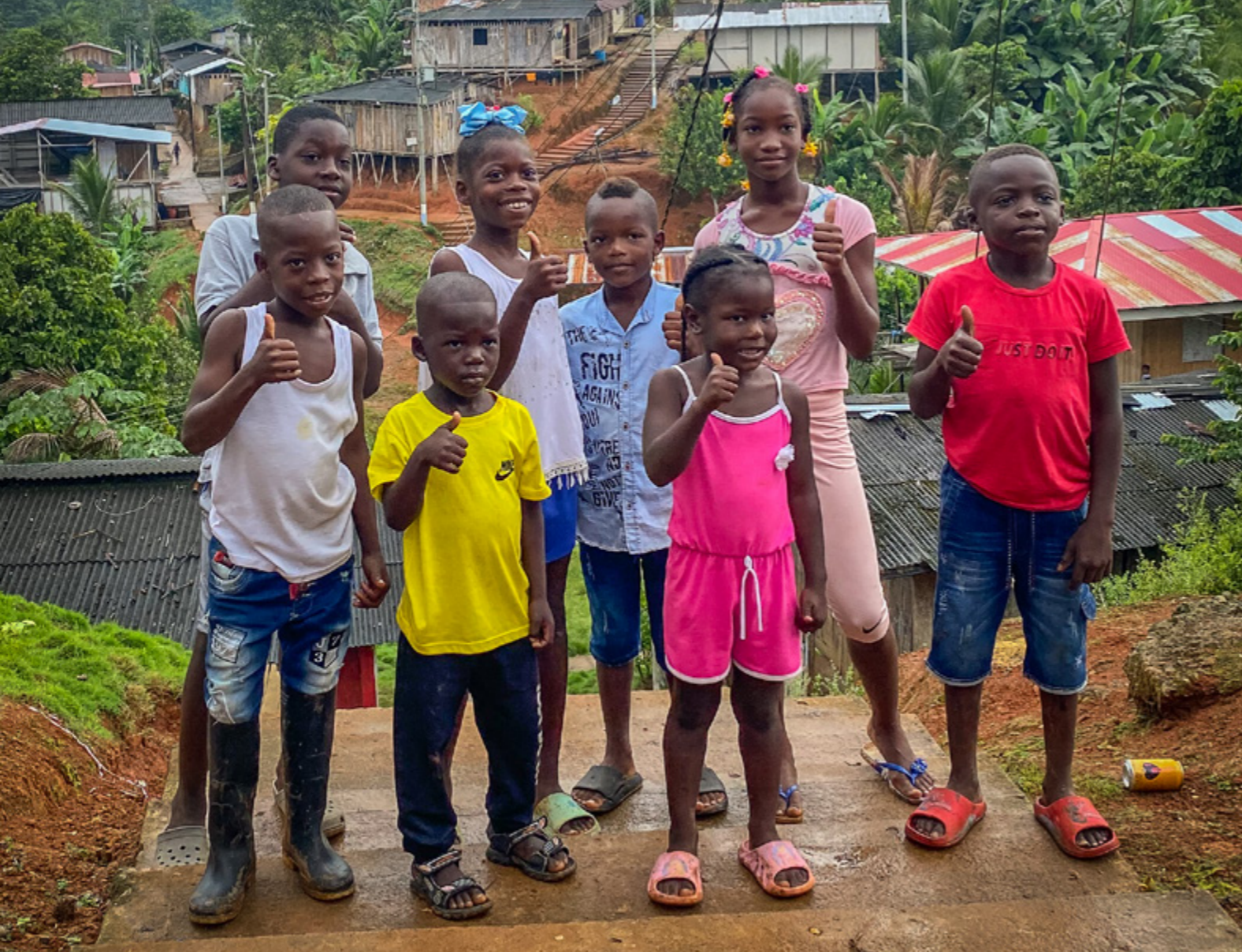
Jeunes bénéficiaires du projet de production de chocolat « de la fève à la tablette » destiné à des communautés colombiennes.

Par ailleurs, nous avons continué à soutenir des communautés qui avaient déjà conclu des accords locaux afin qu'elles conservent leur capacité à prévenir la résurgence des conflits.