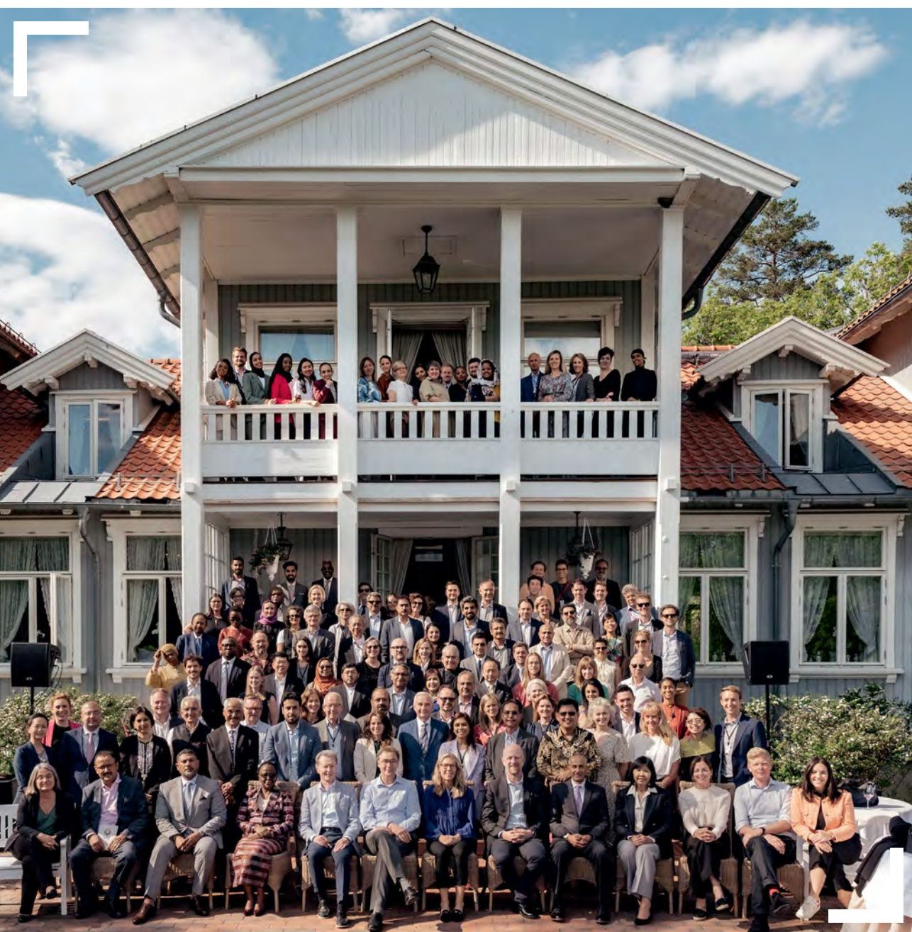
Participants et participantes du Forum d'Oslo 2023

À l'heure où le paysage des conflits est de plus en plus complexe et imprévisible, développer des idées et des approches novatrices devient indispensable.