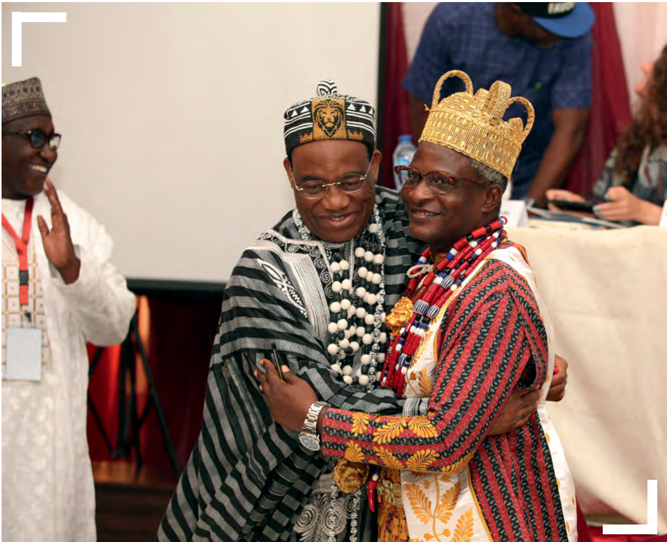
Deux chefs suprêmes de l'État de Benue signent l'accord de paix sur les ressources naturelles de Konshisha et Oju

Avec la résurgence des tensions géopolitiques, la médiation interétatique gagne de l'importance. HD a, dans différents contextes, traité les conséquences résultant de conflits et de tensions interétatiques en suggérant de nouvelles idées aux parties aux négociations et aux équipes de médiation, en assurant une liaison entre elles, en soutenant de grands processus de paix et, parfois, en facilitant ses propres processus de dialogue. Notre contribution est particulièrement utile lorsque les relations diplomatiques officielles sont compromises par des problèmes de communication et des malentendus ou que la situation politique les rend tout simplement impossibles.