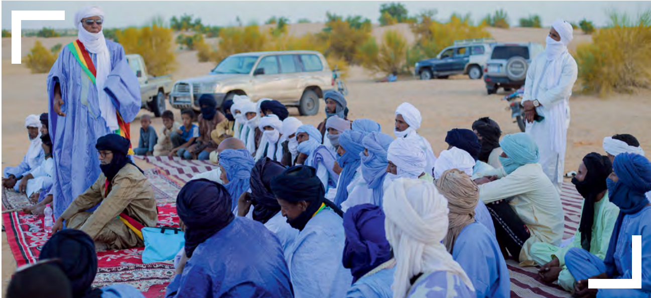
Cérémonie de signature de l'accord d'Achouratt dans la région de Taoudéni, Mali / HD

Par ailleurs, nous devons impérativement apprendre à mieux adapter nos messages aux bailleurs de fonds traditionnels comme nouveaux pour augmenter nos financements. Plus généralement, nous renforcerons notre communication externe en élargissant l'éventail de nos contenus multimédias et en cultivant nos relations avec les tiers désireux de promouvoir notre travail.