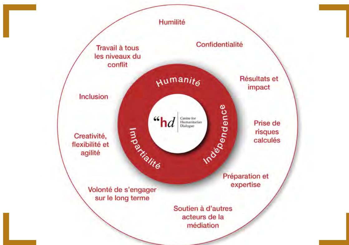
Figure 3. The HD Way : valeurs et principes fondamentaux pour une pratique efficace de la médiation

Le Conseil de fondation de HD régit l'organisation et en assume la responsabilité suprême. Il définit la direction stratégique de HD et supervise et approuve son budget et son programme annuel de travail. La direction de l'organisation est déléguée au Directeur exécutif, qui est aidé dans sa mission par l'équipe de direction.