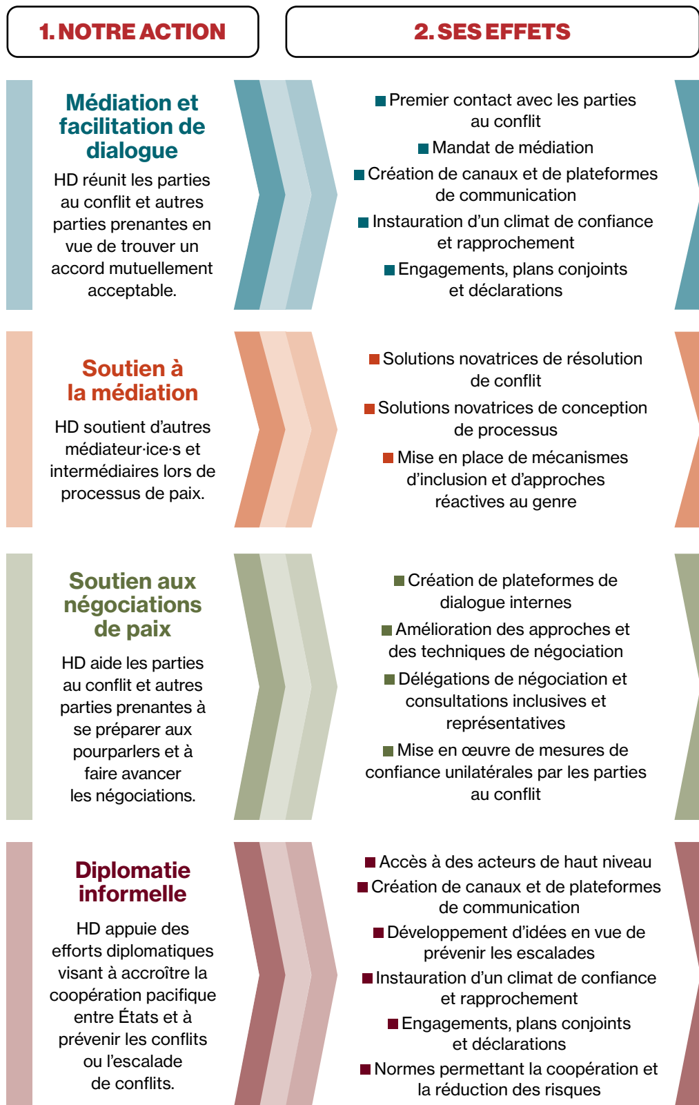
Figure 2. La contribution de HD à la paix