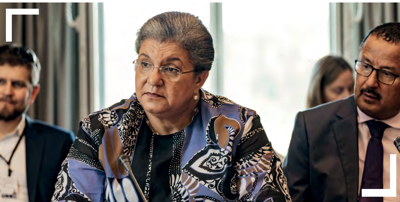
Hanna S. Tetteh, Envoyée spéciale de l'Union africaine pour la Corne de l'Afrique / Forum d'Oslo

de nos solides réseaux locaux pour identifier et concevoir des ouvertures stratégiques et permettre aux femmes, aux jeunes et aux groupes marginalisés de contribuer aux efforts de paix.